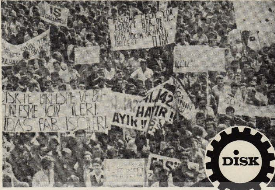
DİSK ilkeleri yüzbinlerce işçide yaşıyor.

İktidarlar, patronlar ve işbirlikçileri, kurulduğu günden başlayarak DİSK'e karşı savaş ilan ettiler. DİSK'i yok etmek ve gelişmesini önlemek için, polis ve jandarmayı, işverenlerce tutulan paralı silahlı adamlarını DİSK'in örgütlenme çalışmalarının,