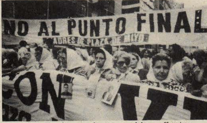
Arjantinli analar cunta dönemi sorumlularını affetmiyor.