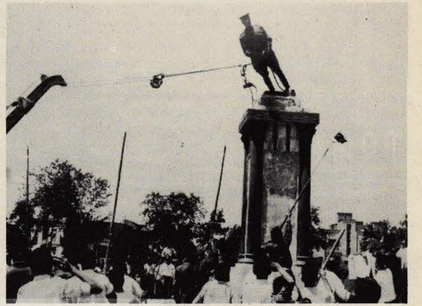
İran 1953: Halk Şah'ın heykellerini devirirken.

25 Haziran 1953'te zamanın henüz birkaç aylık, çiçeği burnunda ABD başkanı Eisenhower'ın atadığı Dışişleri Bakanı John Foster Dulles'in bürosunda "ortak özelliklere" sahip onbir kişi bir aradaydı; eski bir CIA ajanı bunlar için "pis işler yapmaya hazır