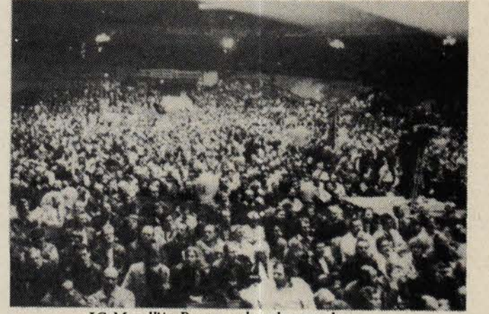
IG Metall'in Dortmund toplantısından

● Ücretlerde indirim olmaksızın 35 saatlik iş haftası,