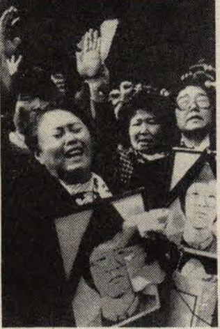
Güney Kore: Analar işkencecilerle direniyor.

Hayatı iki kez üreten kadınlar 8 Mart'ı bir kere daha savaşın ve sömürünün olmadığı mutlu bir dünya, aydınlık bir gelecek mücadelesiyle kutluyorlar. Acıların kararlılığı, kederin direnişe dönüştüğü özgürlük ve bağımsızlık mücadelelerini, bu mücadelenin başarıya ulaştığı ülkelerde yeni toplumun kurulmasına katkıları, tüm dünyada, insanlığa yönelen nükleer savaş tehdidine karşı "yaşamak" talebini yükseltiyorlar.