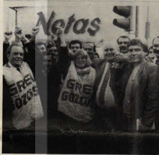
Yabancı sendikacılar NETAŞ grevini ziyaret ettiler.

NETAŞ grevi işçilerin taleplerinin büyük ölçüde karşılanması ile sonuçlandı. Grevçi işçiler ülke içi ve dışında büyük bir destek buldular.