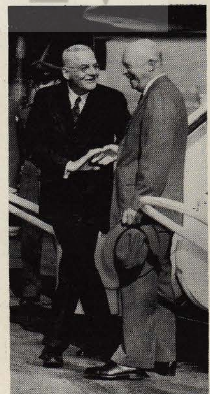
J.Dulles (solda) Eisenhower'le.