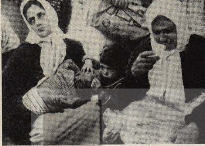
Lübnan'da Filistinli kadınların dinmeyen acıları.