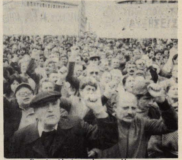
Yunanistan'da yine genel grev yapıldı.

Yunanistan'da hükümetin "kemeri sıkma" politikasına karşı Ocak ayında genel greve giden işçi ve memur sendikaları, Şubat ayı içerisinde bir kez daha genel greve gittiler. 12 Şubat'ta gerçekleştirilen genel greve katılanların sayısı 1,5 milyonu bulurken 200 bin kamu görevlisinin yanı sıra 600 bin esnaf ve küçük işyeri sahibi de greve katıldı.