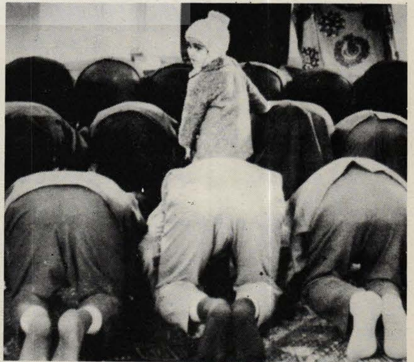
Dindarlarımız. Barış davasına omuz vermiyor, 12 Eylül koşullarında mescit müslümanlığı yapmayı tercih ediyorlar.

Batı'da burjuva bireyin içine düştüğü çağdaş moral tıkanıklık ortamında bir sürü safsata teorii ne zamandır Batı burjuva toplumu için bunalımdan çıkış yolunu toplumun mevcut, çağdaş dinamikleri dışında arama ve bu meyanda sosyalizmi bir çıkamaz, bütöl yol gibi gösterme üzerinde yoğunlaşmıştır. Bu tür teorilerin bir işlevi Batılı burjuva toplum bireyine yöneliktir. Hedef, bireyi Batı'nın tüm olumlu tarihi birikiminden kuşkuya düşürüp depolitizasyonu sürmek, aktif politik süreçlerden koparmaktır. Ama bir çeşit "Batı'ya reddiye" diye nitelendirilebilecek bu tür teorilerin bir başka işlevi daha var: Üçüncü dünya ülkeleri toplumlarına yönelik. Onun içindir ki bu tür teoriler üç aşağı beş yukarı aynı temel argümanlarla, üçüncü dünya ülkelerinde de özellikle entelektüel çevrelerle ısrarla aşılanmaya çalışılıyor. Maddi temellerinden ve tarihi pratiklerinden soyutlanmış "yerli toplumlar" hay-