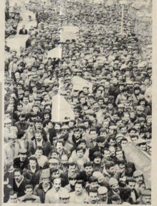
Kozlu'da cenaze törenine binlerce işçi katıldı.