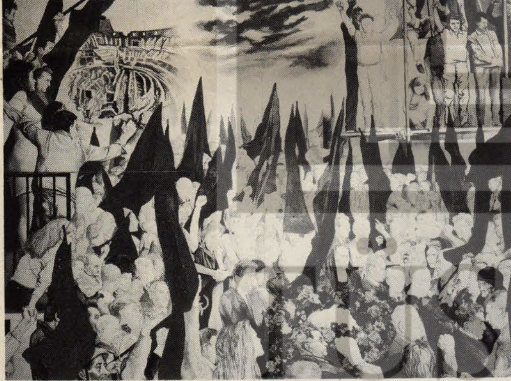
Togliatti'nin Gömülmesi (1972)

Geçen sayılarımızda hatalı olarak çıkan resimaltı yazılarını Yoksul Mutfağı (Brueghel) ve Un Eleyenler (Courbet) olarak düzeltir, yazarın de okurlarımızdan özür dileriz.