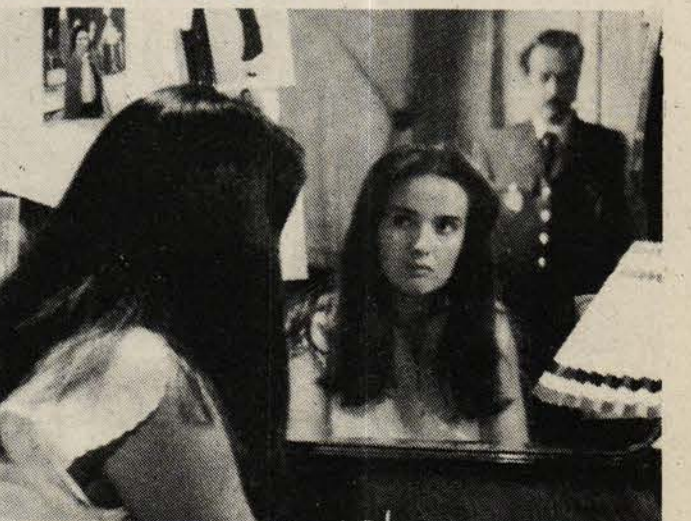
Yasaklanan "Teyzem" filminden

Kısaca, rejimin karakterine uygun olarak sanat-edebiyat alanını da zapturapt altına almak için gereken düşünülmüştür. İş, bu kurulu hep meşgul etmeye kalıyor!