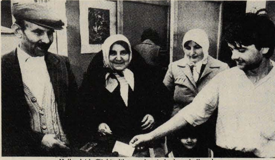
Hollanda'da Türkiyeliler yerel seçimlerde oy kullanırken